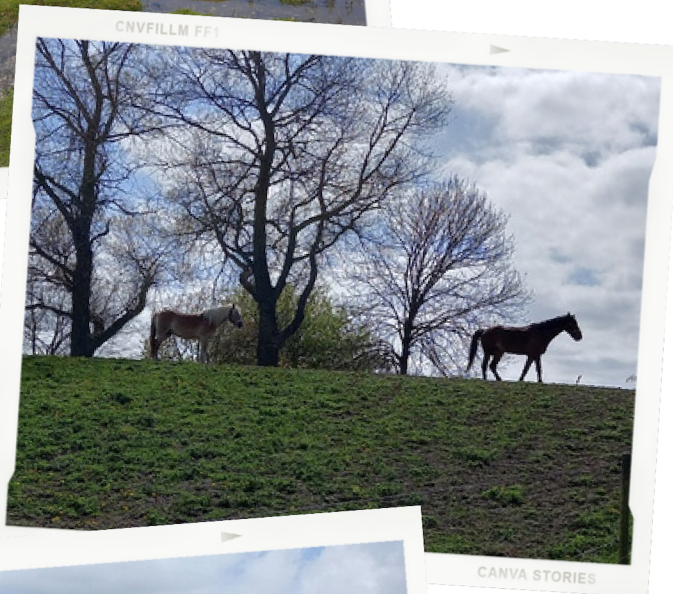
De paardjes op de dijk