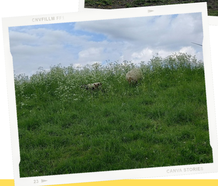
Zoek de schaapjes!