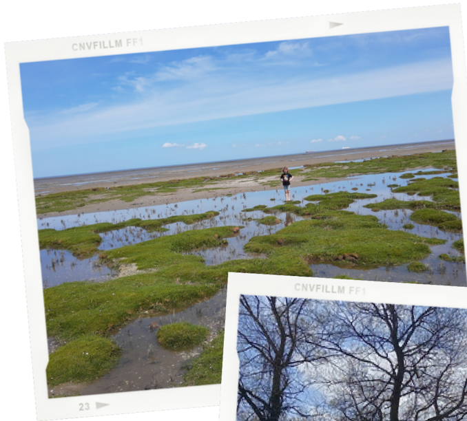
Eilandje springen in de kwelder

Onderstaand een impressie van ingezonden foto's rondom biodiversiteit, werkverkeer en/of andere bijzondere of opvallende gebeurtenissen in en om Oudeschip.