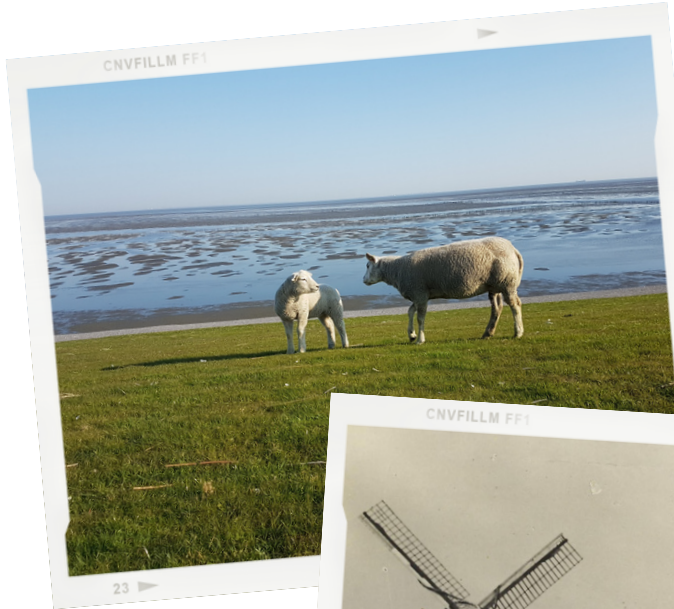
Schaapjes op de dijk

Onderstaand een impressie van ingezonden foto's rondom biodiversiteit, werkverkeer en/of andere bijzondere of opvallende gebeurtenissen in en om Oudeschip.