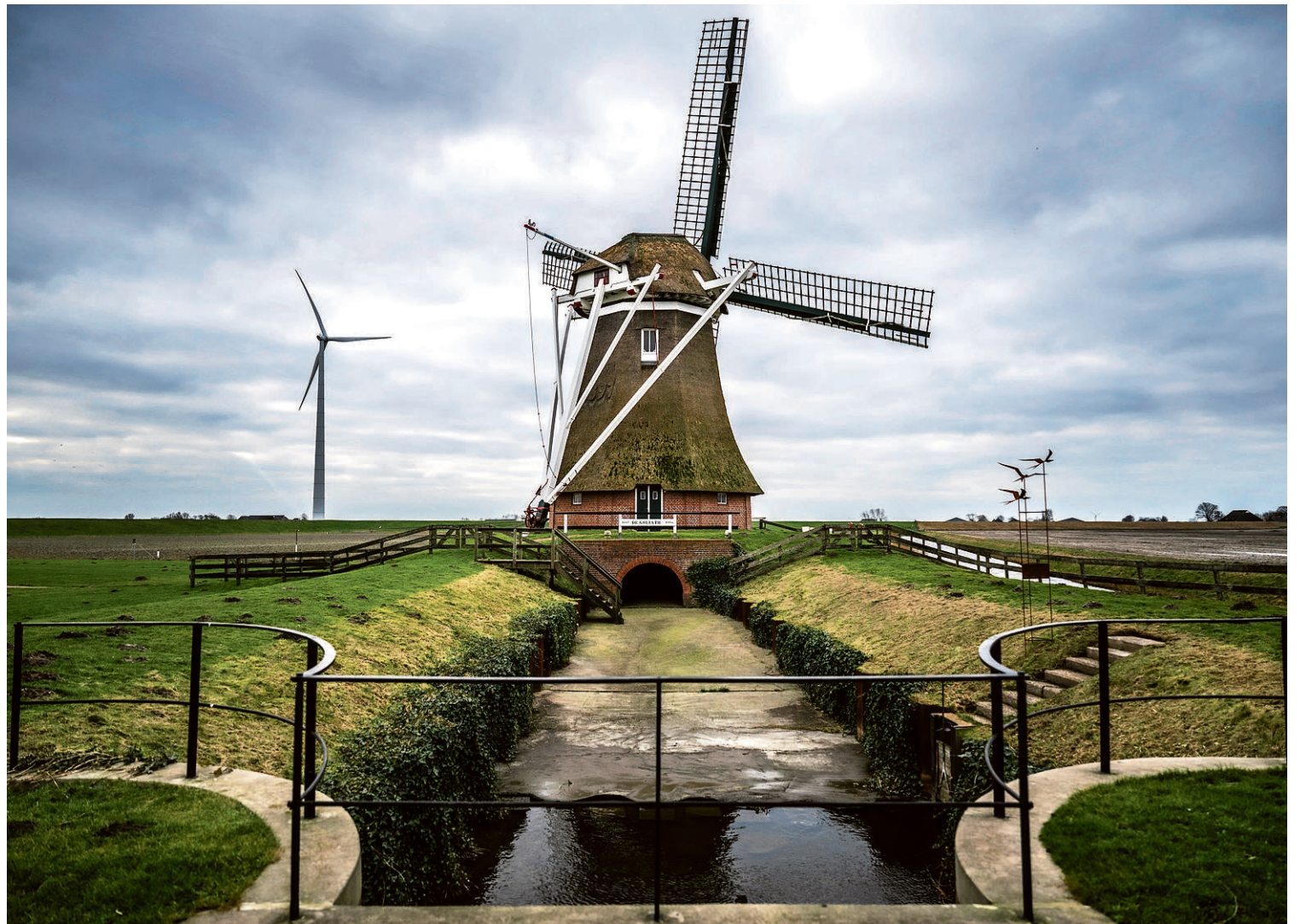
Eeuwenlange inpoldering, de Eemshaven rukt op.

Het ‘zeewiefke’ zou aldus zijn gedoemd haar dagen te slijten in die kolk, woedend rondwervend in het water, zinnend op wraak voor haar wrede lot. Dat zou het leven