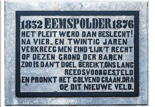
Gedenkplaat in de sluis bij molen Goliath.

De Groninger boeren zijn volstrekt niet bereid ook maar een reepje klei af te staan. Ze verzetten zich uit alle macht en krijgen hulp van een Warfumer huisarts. Deze Rembertus Westerhoff ontdekt dat die Franse