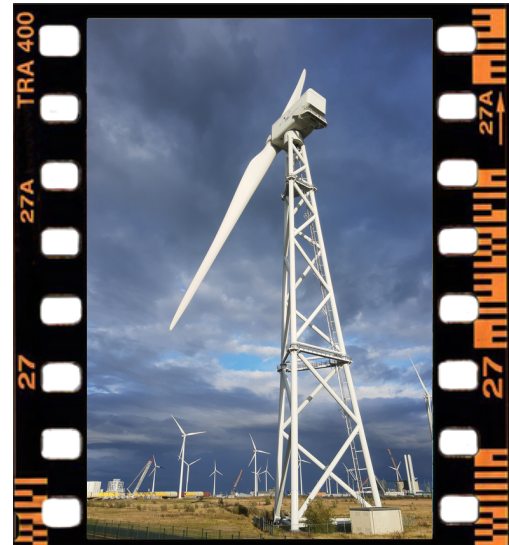
Windmolen in de Eemshaven